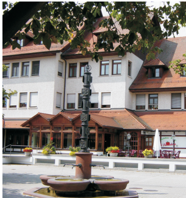
Blick vom Untertorplatz auf das Gebäude der Stadtwerke Radolfzell GmbH mit dem Kunden-Center.

Stadtwerke Radolfzell GmbH Untertorstraße 7 - 9, 78315 Radolfzell